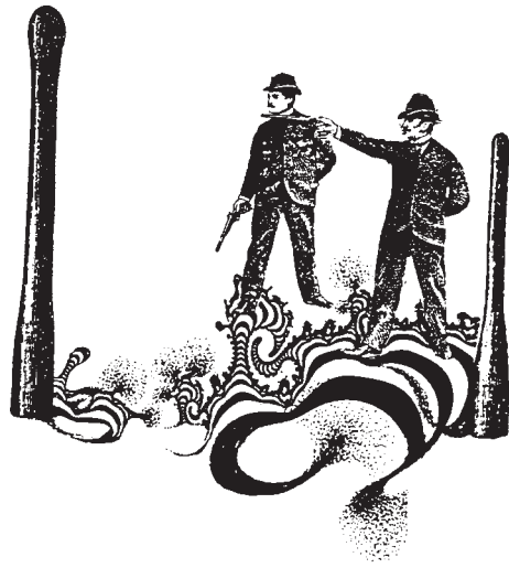
Figure 11: les applicateurs

première application secondaire: applicateur